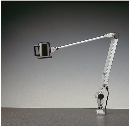
LED3 MGL | 3x1,2 W | Reibungsgelenkarm