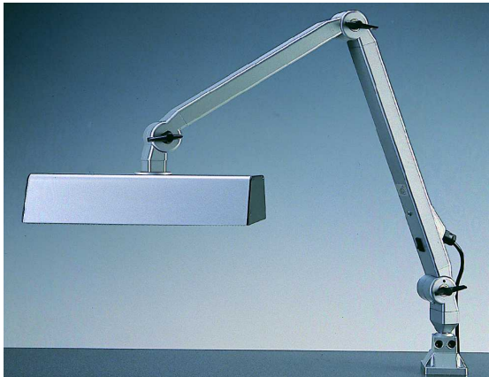
M-LED Variante | 12 W | Reibungsgelenkarm | Hoher Ausstrahlwinkel